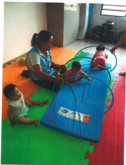
Projeto Remexer – Circuito com obstáculos