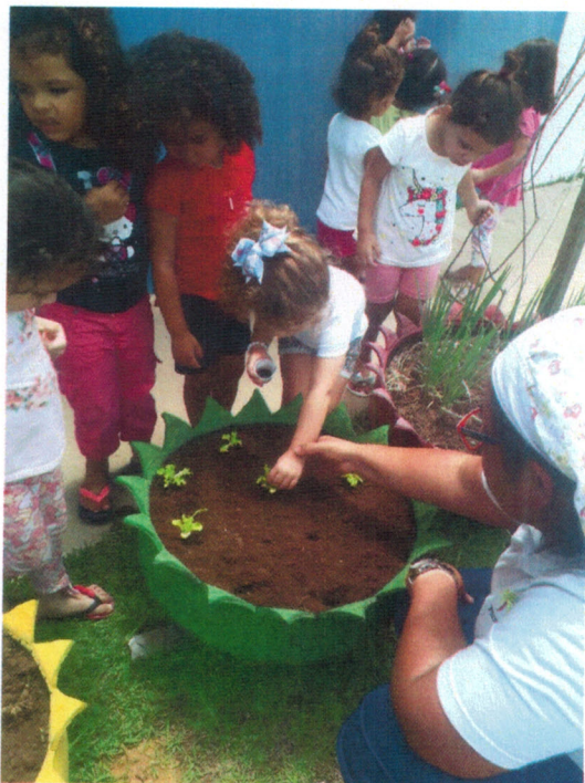
Projeto Sementinhas do Bem – Plantio de alface e tomate