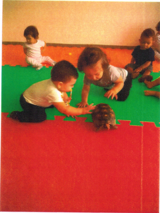
Projeto Observação – Visita da tartaruga