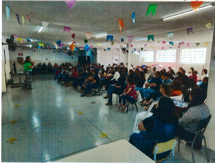
Reunião de Planejamento em 27 de julho

Fonoaudióloga - Equipe Niape (Núcleo Integrado de Apoio Pedagógico Especializado) Tema: Desenvolvimento e estimulação de fala e de linguagem